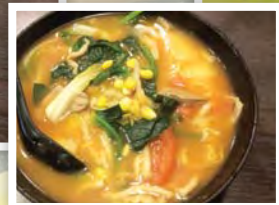
豬潤肉片蕃茄 薯仔湯米線