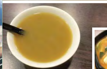
西洋菜生魚 煲豬肉湯