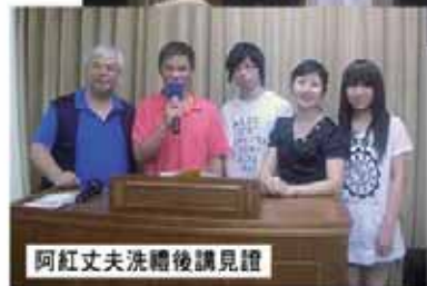
阿紅丈夫洗禮後講見證