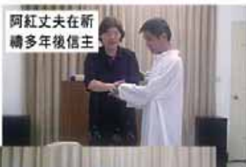
阿紅丈夫在新 禧多年後信主

今天阿紅完全放低了新移民身份的包袱，努力工作之餘，她亦願意向身邊的人分享她的經歷，並進入神學院進修。當問及她是否想作全職的傳道人時，她表示想幫助身邊的工友，假若離開了酒樓的工作，就更難明白她們的需要，希望在職場上宣揚耶穌的福音。