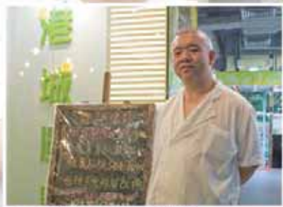
▲ 阿康感謝公司的包容和接納