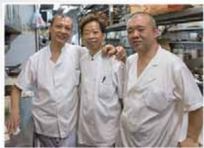
▲ 工作上的伙伴成為阿康的好友

在阿康識認耶穌以後，除了成功戒賭外，更醫好背傷舊患。這舊患讓阿康暫止工作足足一年時間，但因為沒有信心，阿康一直沒有接受手術，直至停工一年後，阿康在明愛醫院，得到醫生清楚解釋，明白手術情況，令他有信心接受手術，結果十分成功。「很感謝耶穌，祂給我一位好醫生，講解十分清晰，我就有信心了。」