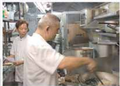
▲ 不再被舊患困擾的阿康