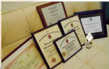
鴻濤現在所得的專業成就與認同，就是證明過往的經歷不是白費的

今天，鴻濤回望過去，明白到飲食業人仕面對的家庭危機，就是沒有時間放在家庭裡，建議嘗試將家庭放於首位，並要明白家庭永遠比工作更重要，將工作壓力嘗試與家人分享，這樣即是從事任何職業，也能得到美滿的家庭生活！