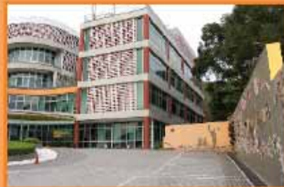
突破青年村位於新界沙田亞公角山路

他表示現在的工作環境是一個好好的場地去接觸年青人，他看到很多美好的片段，看到年青人的生命有所改變。他總結道：「我們的日子有多少，我們不知道，作為基督徒，能夠傳的就該當傳，還要等待什麼呢？」